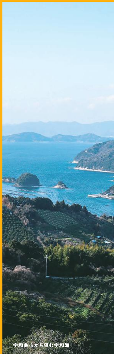
宇和島市から望む宇和海

高校生向け求人情報の詳細については学校またはハローワークを通じて、求人票をご確認ください。 掲載内容は2019年7月時点の情報です。変更される場合があります。